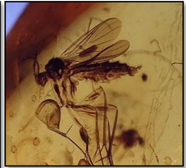
Myg med ? mide på benet 3-4 mm

Amber Man eller Brian Barnes har venligst givet tilladelse til at bruge de fantastiske fotos, som I ser her i artiklen. På Facebook har han en gruppe: "The Amber VIP Club", dér fremvises stykkerne med omtale og kommer på www.amber-with-insects.com , hvor priser også findes. HUSK, når man handler uden for EU, så kommer der moms og told på ved køb over 80 kr. + gebyr på 160 kr. til POSTNORD for opkrævningen af told/moms.