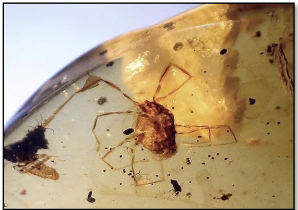
(=nr 3 ovenfor), Mejer, orden Opiliones 6,3 mm