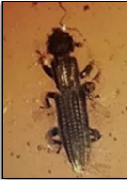
Bille Archostema sp. 15 mm