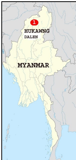
Hukawng -dalen med mine "1"