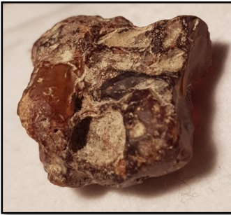
Rå klump burmesisk rav 3 cm