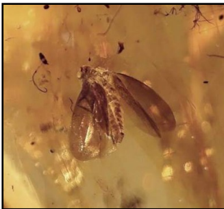
Sommerfugl-møl 5 mm