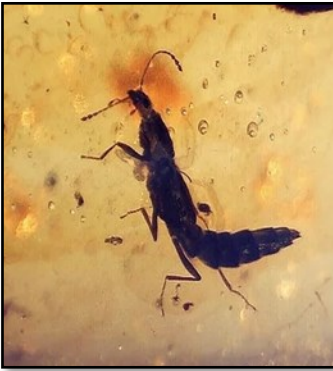
Bille Staphylinidae (familie) 3-4 mm