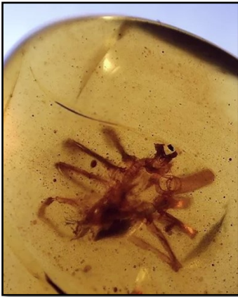
Edderkop 5 mm