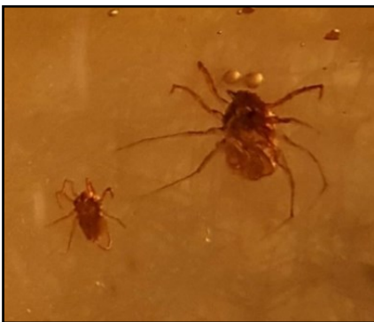
Mider, den største under 1 mm