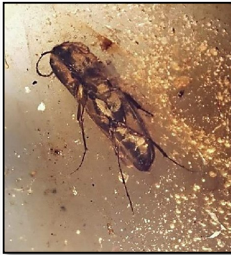
Bille, familie Elateridae 8 mm