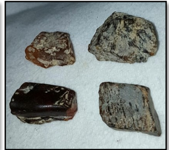
4 Stykker Dominikansk rav 2 cm