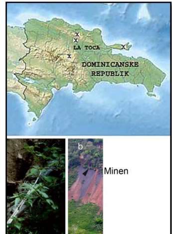
La Toca Formationen og miner ved "b"

Det var lidt fra samlingen. Når flere kommer til, kommer der nok en lille artikel mere fra denne fantastiske miniverden. Mange tak til Brian Barnes for lån af fotos, så denne præsentation blev mulig.