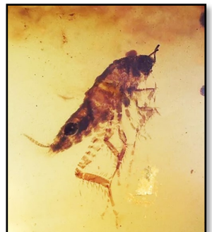
Kakerlak 12 mm