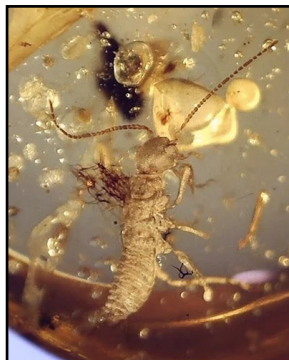
Termit 3 mm