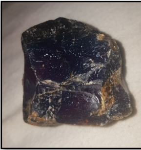
Blåt rav fra Dominica 5 cm