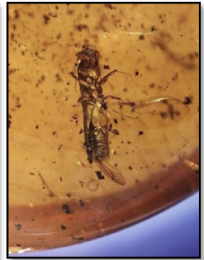
Bille, familie Platypodidae 4 mm