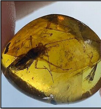
Græshoppe 15 mm