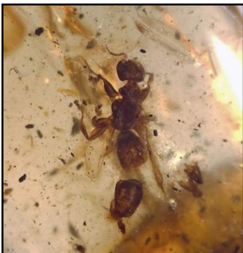
Hveps 4 mm