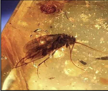
Vårflue 15 mm i Dominikansk rav

Her til slut lidt om Rav fra Dominica . Dette rav er ungt, kun 20-30 millioner år gammelt og indeholder også insekter og så også noget så spændende som hår fra pattedyr. Ravet kommer fra La Toca Minerne. Herfra kommer også det blå rav.