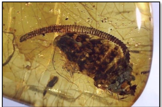
Tusindben og kakerlak 15 mm